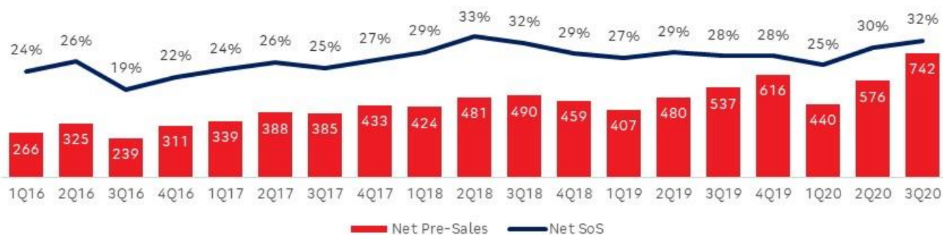
Net Pre-Sales (PSV, R$ million) and Net SoS (%)