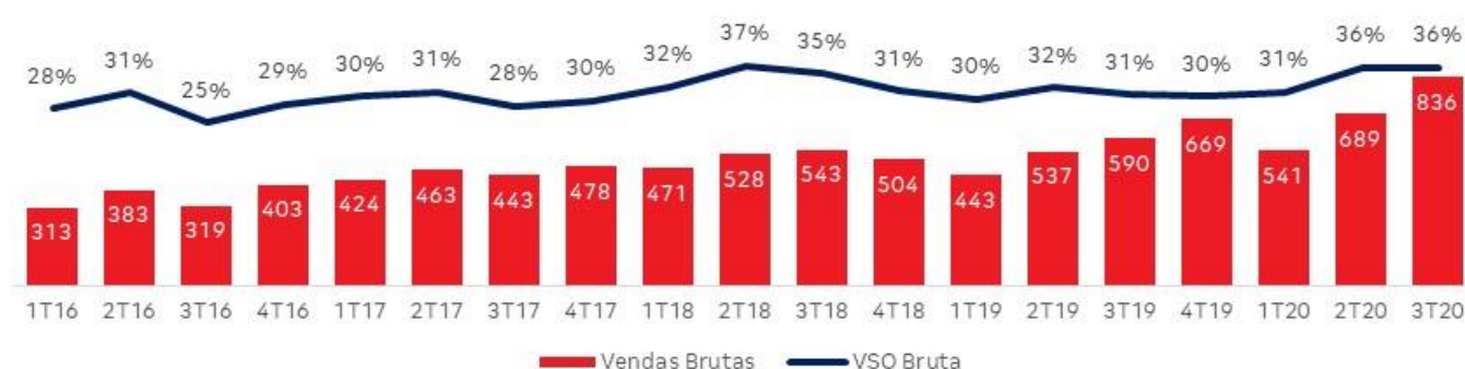
Vendas Brutas (VGV, R$ milhões) e VSO Bruta (%)